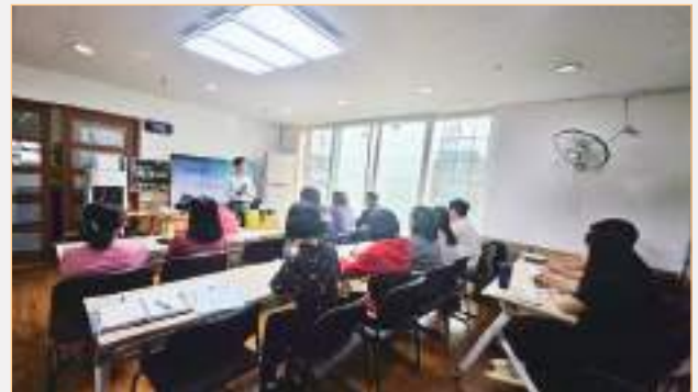
종사자 인권교육 (전북사회서비스원)