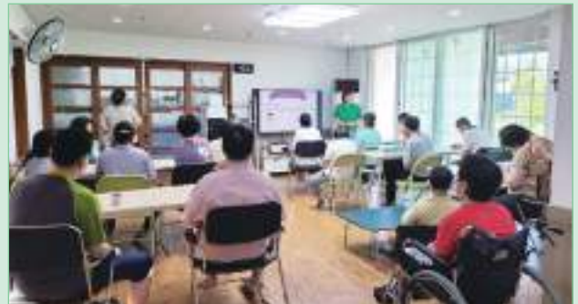
이용인 전염병 예방교육