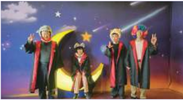
‘문화거리 go100star’에서 다양한 소품들과 사진 한 컷