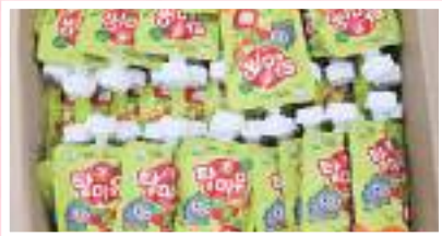
농업회사법인(주) 삼성농원 2공장