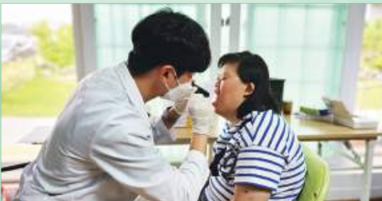
구강검진 (전북대 치과병원)