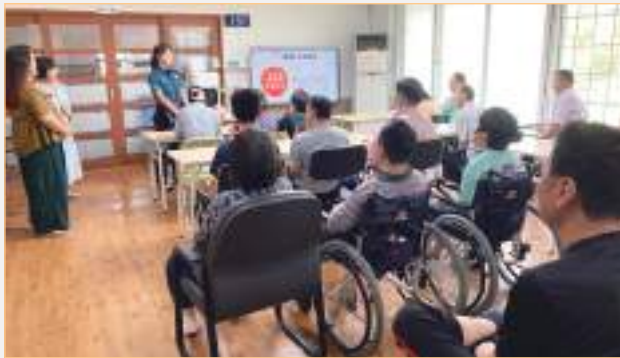
이용인 성폭력 예방교육