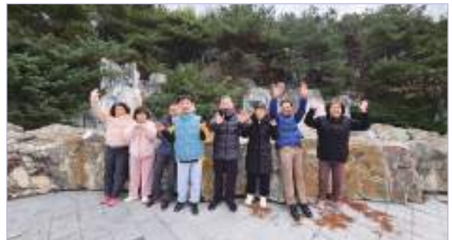
추위 속에서 서로의 손을 잡고 다녀온 공원 산책