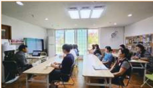
종사자 장애인학대 예방교육 (장애인권익옹호기관)