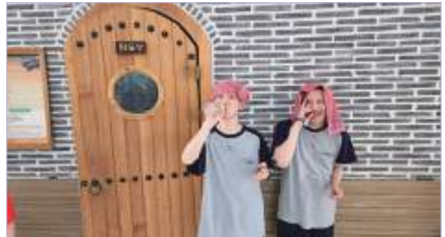
양머리를 하고 찜질방에서 힐링의 시간을