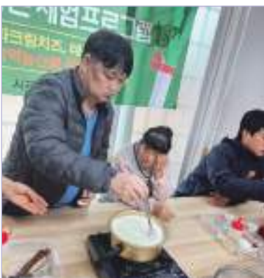
익산시민과 함께하는 체험프로그램 - 치즈만들기