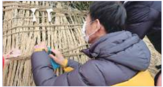
정월대보름놀이에서 달집태우기 전 소원 묵기