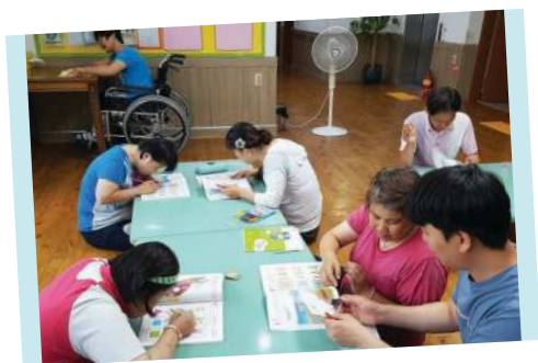
▲ 한글·수 프로그램