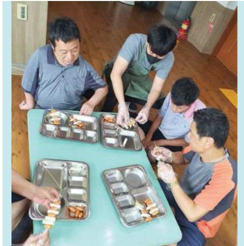
요리 프로그램 ▲

장애로 인해 배움의 기회가 적었던 부분을 해소하고 기본소양교육과 신체기능향상에 도움을 줄 수 있는 프로그램을 진행합니다