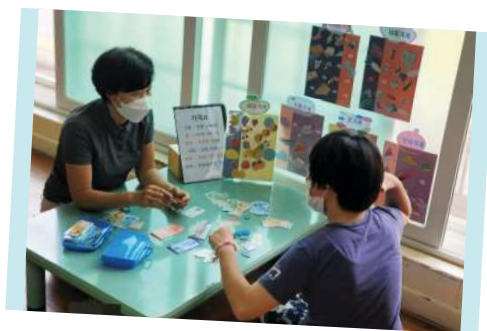
금전관리 프로그램 ▲