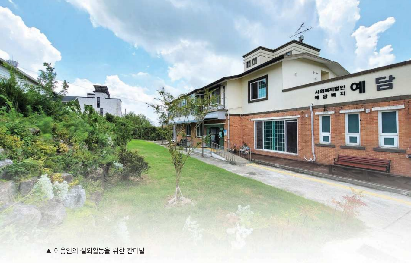
▲ 이용인의 실외활동을 위한 잔디밭