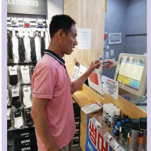
마트 이용체험 ▲

시설내 환경을 벗어나 경험해 보고 체험함으로써 사회적능력의 향상을 도울 수 있습니다. 다양한 사회적 경험을 통해 자신의 능력을 향상시키면서 비장애인과 함께 사회구성원으로 살아갈 수 있도록 합니다.