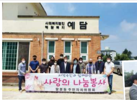
▲ 팔봉동 주민자치위원회