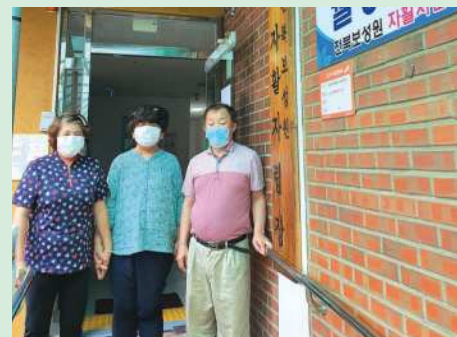
▲ 자활자립장 가는길