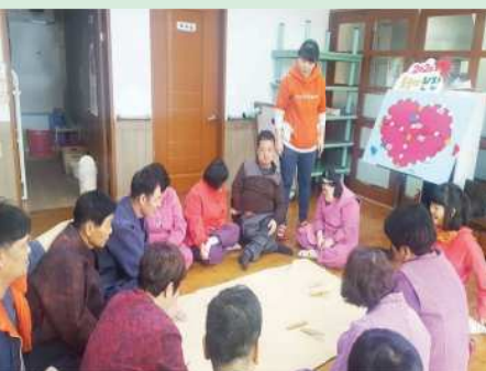
▲ 명절 전통놀이