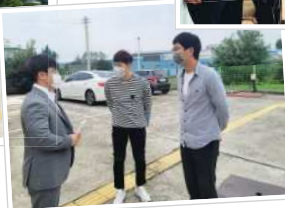
▲ 전라북도 동물위생시험소 북부지소