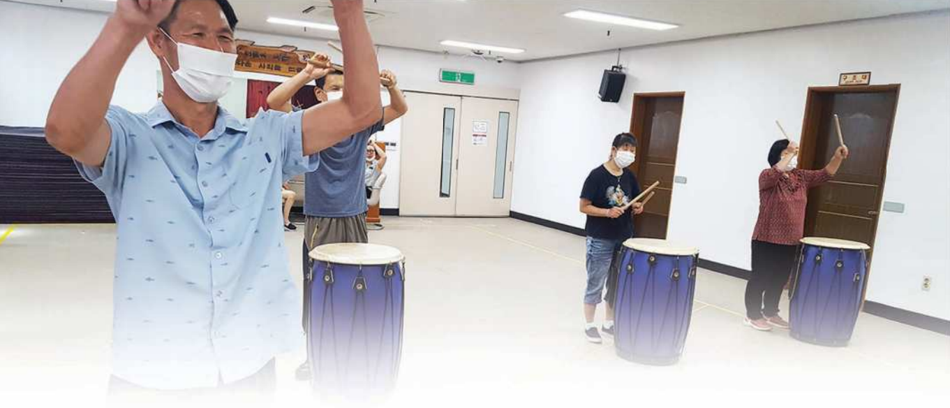
난타 프로그램 ▲