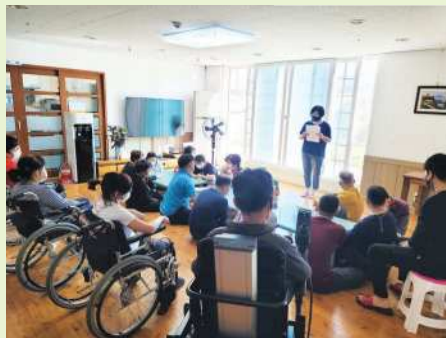
▲ 이용인 회의