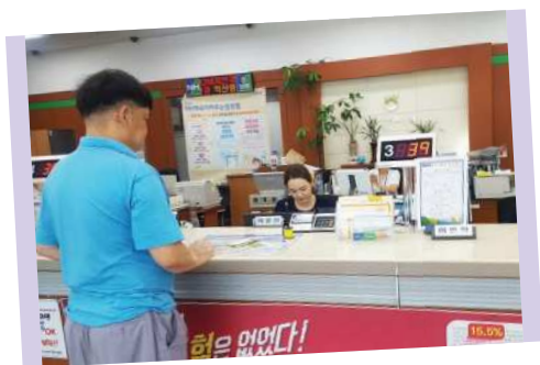
▲ 은행 이용체험