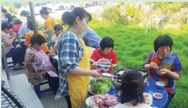
◀ 삼겹살 파티

외부활동을 못하고 시설내에서 생활하는 이용인의 무료함을 줄이고, 스트레스를 해소하기 위해 이용인이 좋아하는 음식을 선정하여 파티를 하였습니다. 모처럼 즐겁고 힘이나는 시간이 된 듯 합니다.