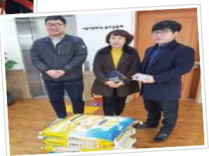
▲ 광주 고용노동청