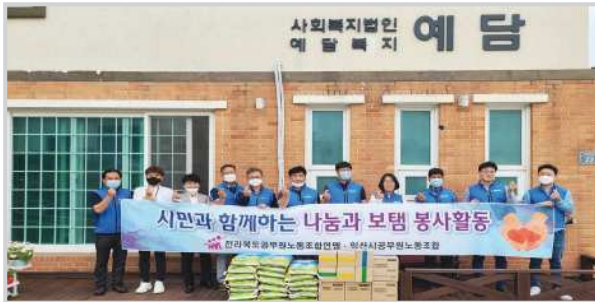
▲ 익산시 공무원 노조

코로나19로 예담을 찾는 발걸음에 어려움이 있었지만, 예담 가족들을 생각해주시는 따뜻한 손길에 감사의 마음을 전합니다.