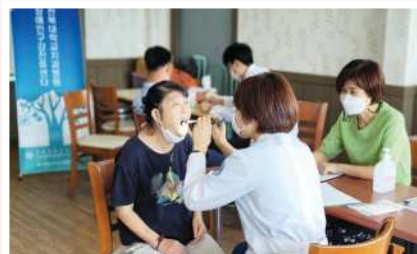
구강검사 (전북대학교 치과 병원 장애인 구강진료센터)