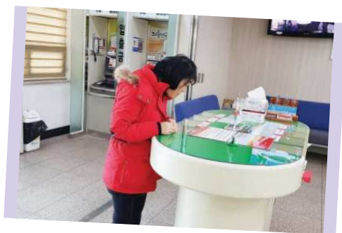
편지 발송체험 ▲